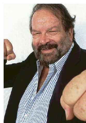
L'attore Bud Spencer