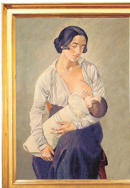
La mostra la "Maternità" di Gino Severini

Il clima generale di incertezza, determinato dagli effetti del conflitto, dalla difficile transizione economica e dalle rilevanti trasformazioni sociali e culturali, si riflette in pieno nella straordinaria varietà artistica. Undici capitoli scandiscono il racconto espositivo: a partire dalla sezione «Volte del tempo», spaccato della società dell'epoca, da cui emerge quella «moderna classicità» che connota le