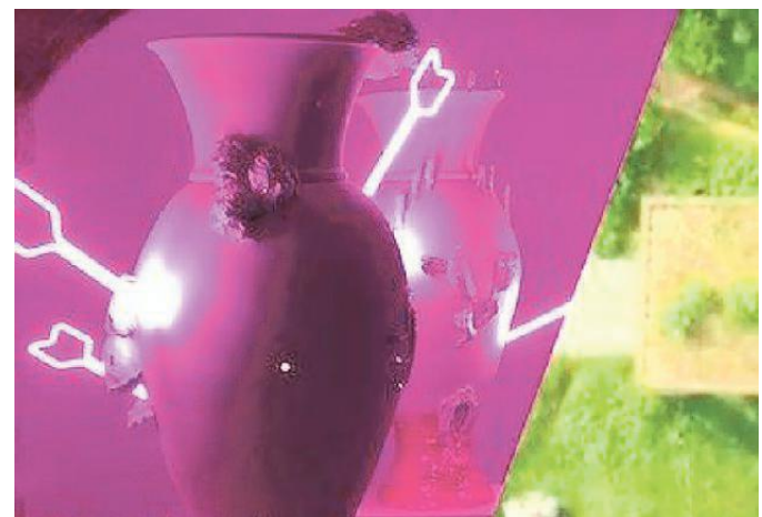
Fine settimana dedicato alla cultura a Savona