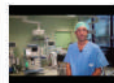
Cuneo, nuova tecnica miniminvasiva per curare il glaucoma: i progressi all'ospedale S. Croce